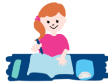
「家庭学習ワーク」などのワークブック